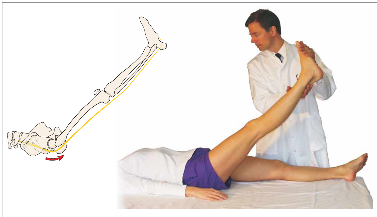
Fig. 2. Strakt benløft-test, Lasègues prøve, foregår med patienten placeret i fladt rygleje. Det smertende ben elevares med strakt knæ og fod i anatomisk normalstilling. Gradantallet, hvor der evt. provokeres smerteudstråling distalt for regio glutealis, registreres, og lidelsen betragtes som en positiv Lasègue hvis gradantallet er mindre end 60 [4].

Anamnese mhp. særlig alvorlige tilstande: udsørg om tidligere sygdom og symptomer, især cancer, urinvejsinfektion, vægttab af ukendt årsag, symptomer på immunosuppression, brug af intravenøse stoffer, smerter, som forværres ved hvile, aktuel feber, spørg om traumer – af relevant kraft i forhold til alderen – især hvis patienten er mere end 50 år, spørg om tegn på medullær påvirkning i form af diffuse symptomer eller udfald af begge ben eller smerter strålende ned langs rygsøjlen, spørg om tegn på cauda equina, dvs. blæreforstyrrelser eller sensibilitetsforandringer anokutant eller i urethra.